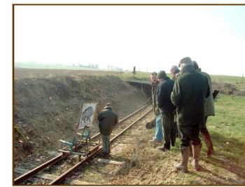
Séance d'entraînement dans un stand de tir permettant d'essayer des balles, de s'habituer et de régler son arme

battue. Rappelons que les balles franches sont lourdes et qu'elles perdent vite de la vitesse. Au tir à balle, il n'y a qu'un projectile, celui-ci doit être bien placé pour immobiliser l'animal en lui évitant des souffrances inutiles.