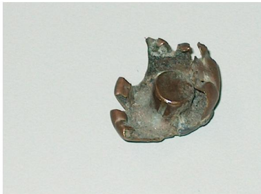
Phénomène d'expansion ( formation d'un champignon)

de choc et ralentit le projectile dans le corps de l'animal).