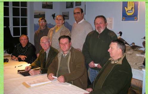
Le groupe des "généralistes" à l'origine de la création de cette branche régionale "Grand Nord-Ouest" de l'U.N.A.C.O.M. (Union Nationale des Associations de Chasseurs d'Oiseaux Migrateurs)