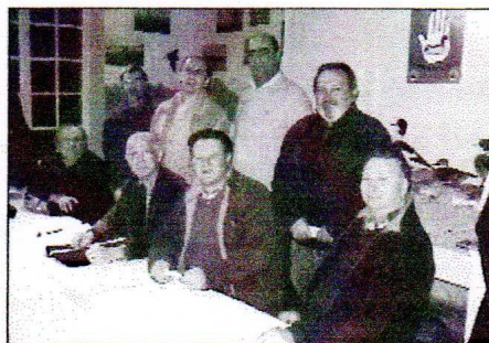
Une image des représentants des chasseurs des départements énumérés lors de la réunion de Saint-Valéry.

Ils demandent au Président de la République et aux institutions, garantes du respect de l'Etat de droit et "non du droit de l'Etat", de prendre résolument les mesures assurant le respect du droit international qui s'applique de facto au droit Européen et National. Ils demandent également aux Élus de la République l'application immédiate de la Convention de Berne qui, contrai-